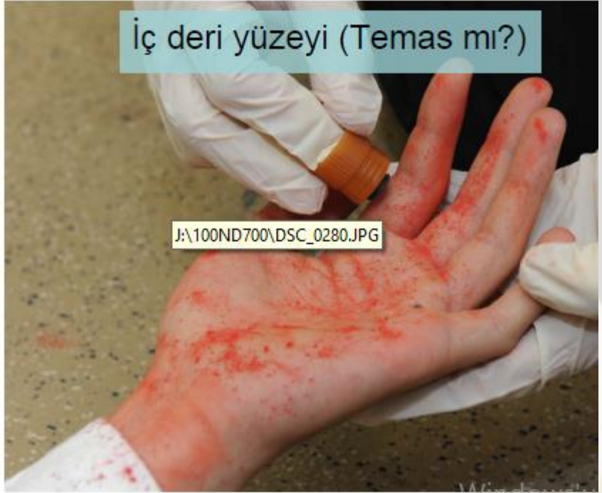
İç deri yüzeyi (Temas mı?)

Maktulün Ellерinden Atış Artığı (GSR) Toplanması