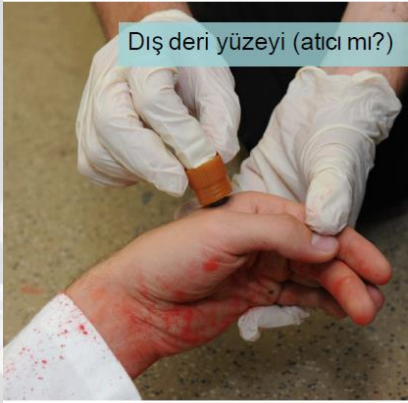
Dış deri yüzeyi (atıcı mı?)

Maktulün Ellерinden Atış Artığı (GSR) Toplanması