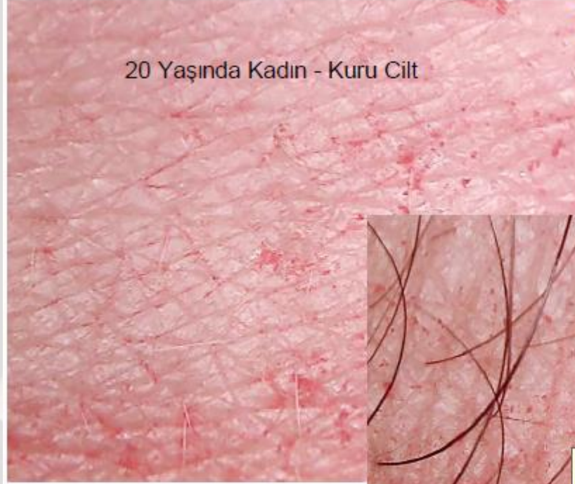
20 Yaşında Kadın - Kuru Cilt