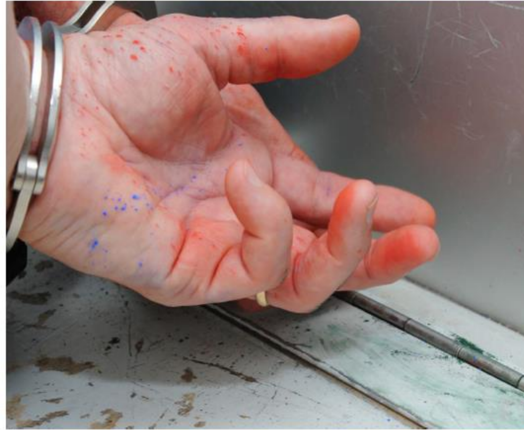
Atıcı (Şüpheli) ve Tanık Polis Aracıyla Götürülüyor